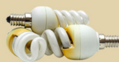
BOMBILLAS DE BAJO CONSUMO